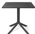
ANTRACITE * 40082.02.000