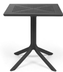
ANTRACITE * 40084.02.000