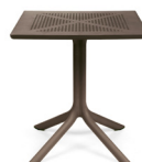
TABACCO * 40084.53.000

* Posizionare in zona d'ombra - Only use table tops in shaded areas - Plateaux qui doivent être utilisés uniquement dans des zones ombragées - Tischplatten nur für beschatteten Einsatzbereich - Utilizar estos tableros sólo en áreas sombreadas - Colocar em local sombreado