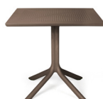
TABACCO * 40082.53.000

* Posizionare in zona d'ombra - Only use table tops in shaded areas - Plateaux qui doivent être utilisés uniquement dans des zones ombragées - Tischplatten nur für beschatteten Einsatzbereich - Utilizar estos tableros sólo en áreas sombreadas - Colocar em local sombreado