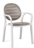
BIANCO TORTORA 40237.00.010